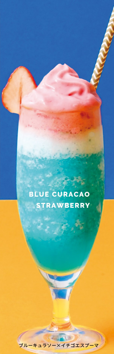
BLUE CURACAO STRAWBERRY

キウイジュース：60g ダイヤアイス：120g キウイシロップ：30g スムージーミックス：10g ×ヨーグルトエスプーマ