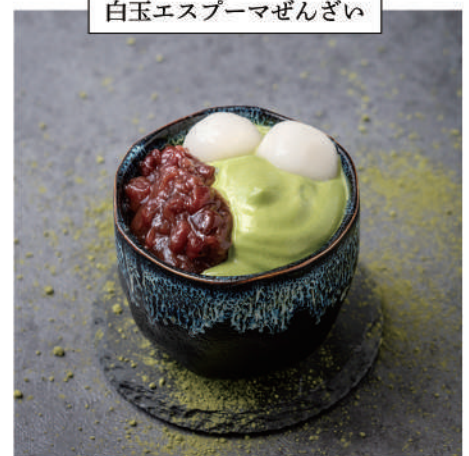
白玉エスプーマぜんざい