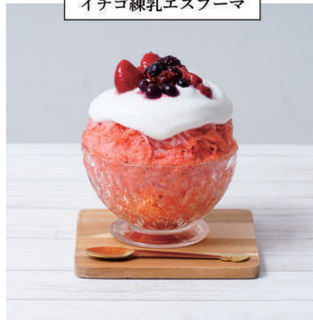
イチゴ練乳エスプーマ

アメリカ産イチゴピューレを使用。甘すぎない、イチゴ本来の甘酸っぱさを感じられます。