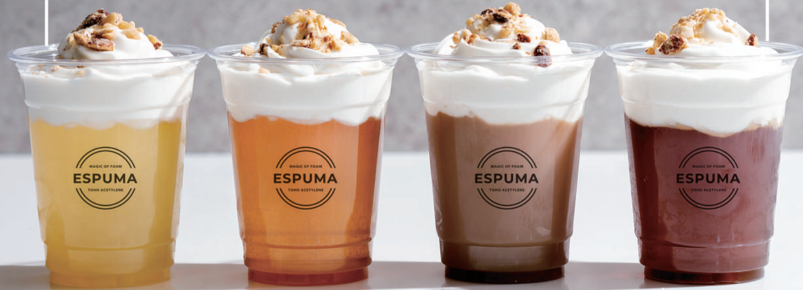
レアチーズエスプーマティー Rare cheese Espuma tea

ふわふわのホイップもとろとろ泡 のソースも自由自在！メニューに 合わせて映える仕上げが可能に なります。