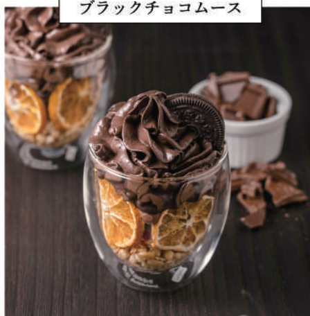
ブラックチョコムース

オーストラリア産ナチュラルチーズを使用し、レモン果汁を効かせてサッパリした味わいに。