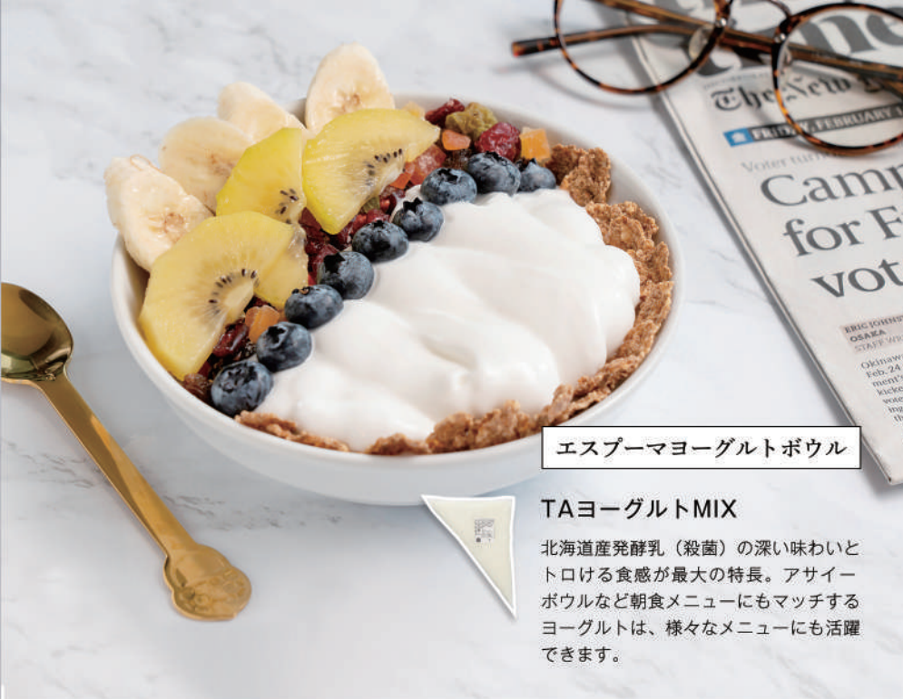
エスプーマヨーグルトボウル

ふわふわホイップもとろとろ泡のソースも自由自在に作れるため「映える」メニューが簡単に増やせます。