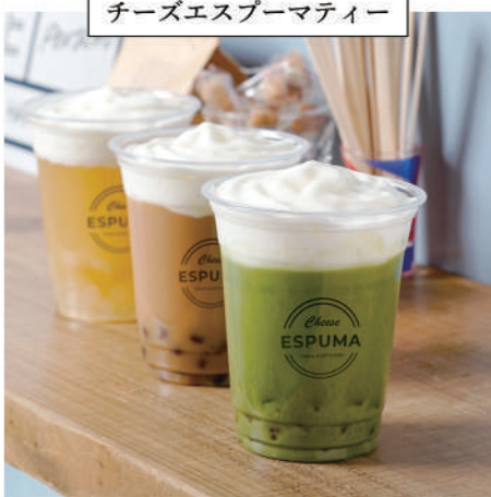
チーズエスプーマティー

マスカルポーネを使用。まろやかなチーズのkokがティラミスの風味を引き立たせます。