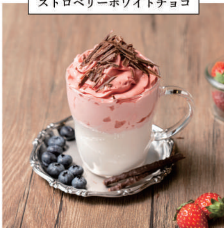
ストロベリーホワイトチョコ

北海道産発酵乳（殺菌）の深い味わいとトロける食感が最大の特長。アサイーボウルなど朝食メニューにもマッチするヨーグルトは、様々なメニューにも活躍できます。