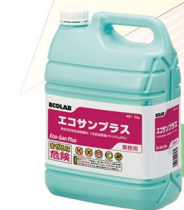
塩素系 漂白・除菌剤