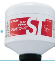
食器洗浄機洗浄剤