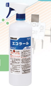
アルコール除菌剤