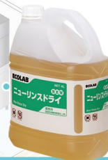
食器洗浄機用乾燥仕上げ剤